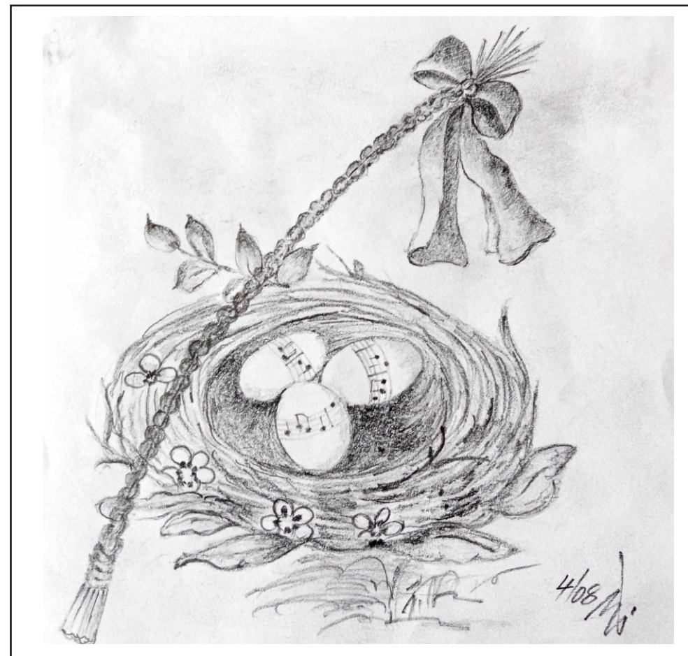
Ilustrace: J. Švajdová

Zpravodaj obcí Březnice - Bohuslavice - Salaš