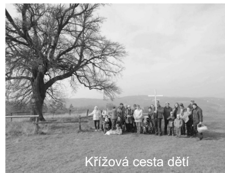
Křížová cesta dětí