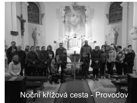
Noční křížová cesta - Provodov