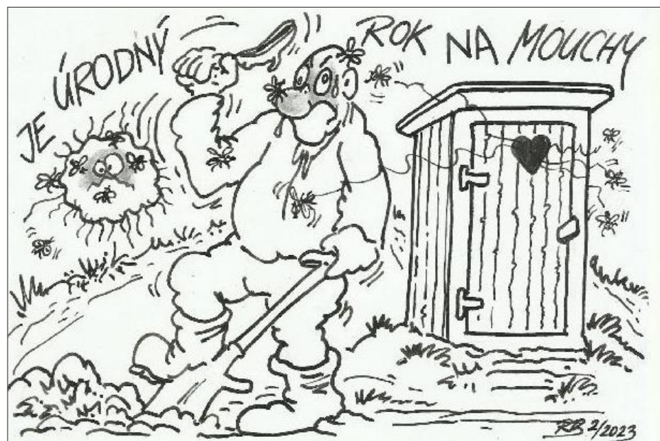
Ilustrace: Radim Bárta