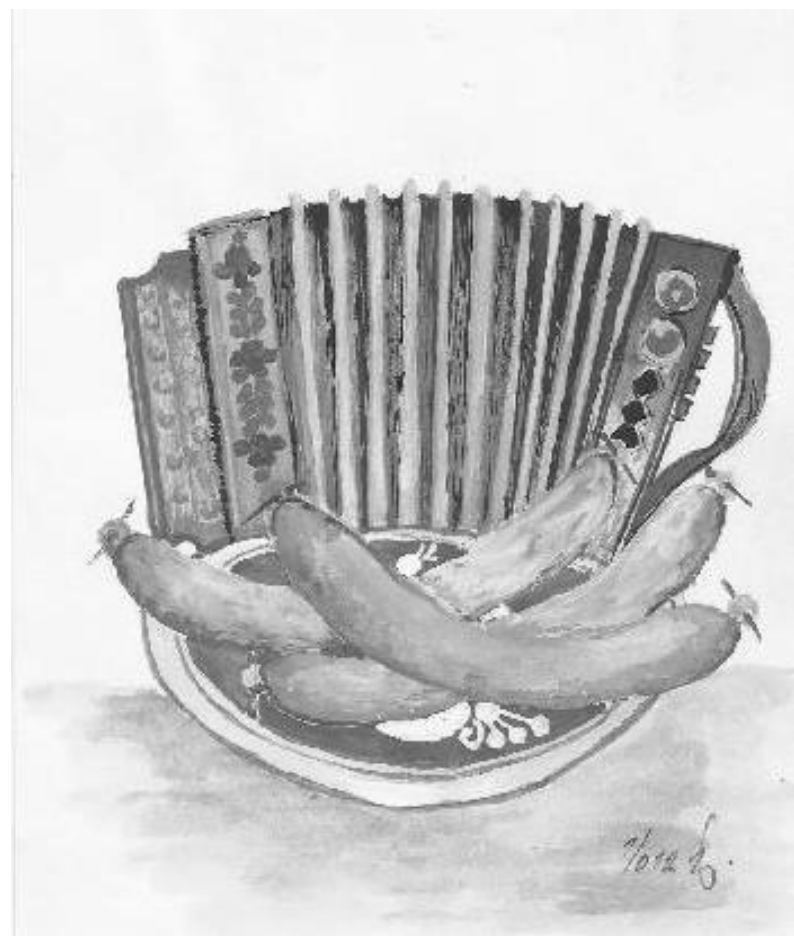
Ilustrace: J. Švajdová

Zpravodaj obcí Březnice - Bohuslavice - Salaš