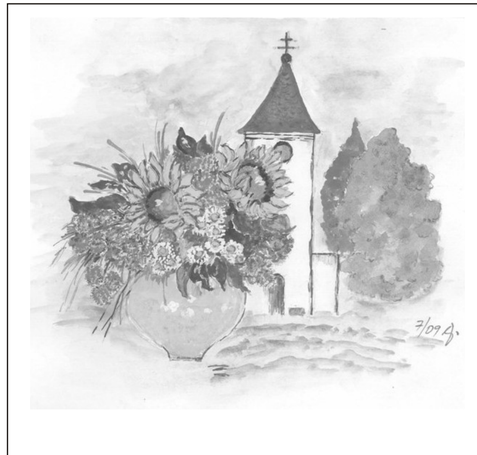
Ilustrace: J. Švajdová

Zpravodaj obcí Březnice - Bohuslavice - Salaš