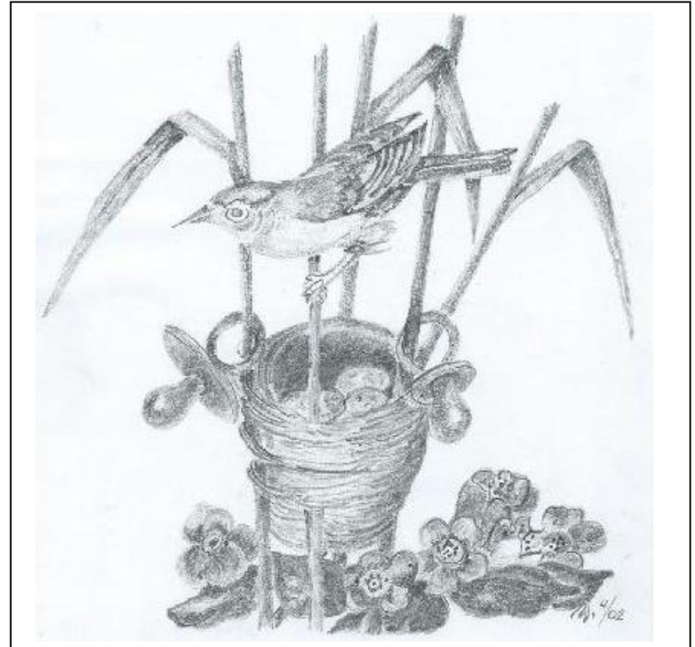
Ilustrace: J. Švajdová

Zpravodaj obcí Březnice - Bohuslavice - Salaš