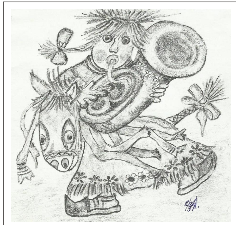
Ilustrace: J. Švajdová

Zpravodaj obcí Březnice - Bohuslavice - Salaš