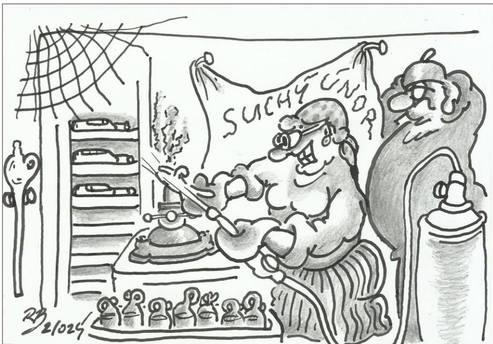
Ilustrace: Radim Bárta