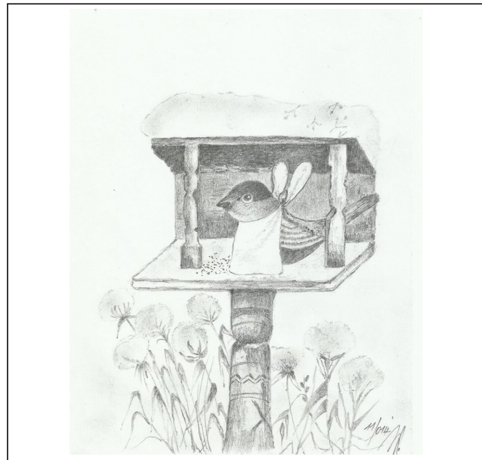
Ilustrace: J. Švajdová

Zpravodaj obcí Březnice - Bohuslavice - Salaš