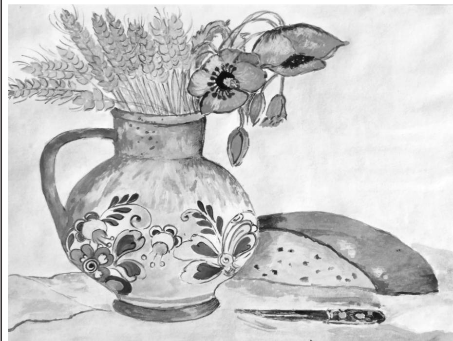
Ilustrace: J. Švajdová

Zpravodaj obcí Březnice - Bohuslavice - Salaš