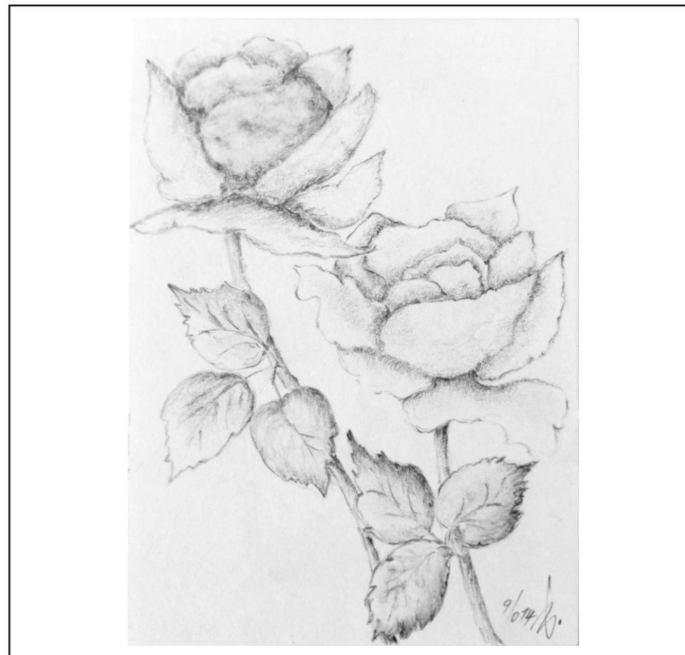
Ilustrace: J. Švajdová

Zpravodaj obcí Březnice - Bohuslavice - Salaš