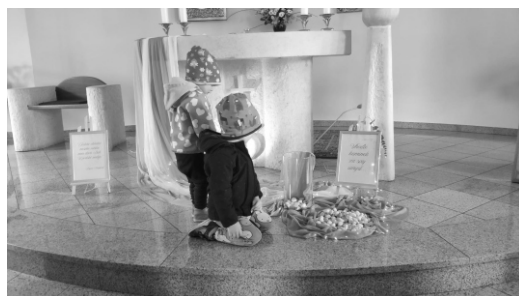
Noc kostelů Bohuslavice