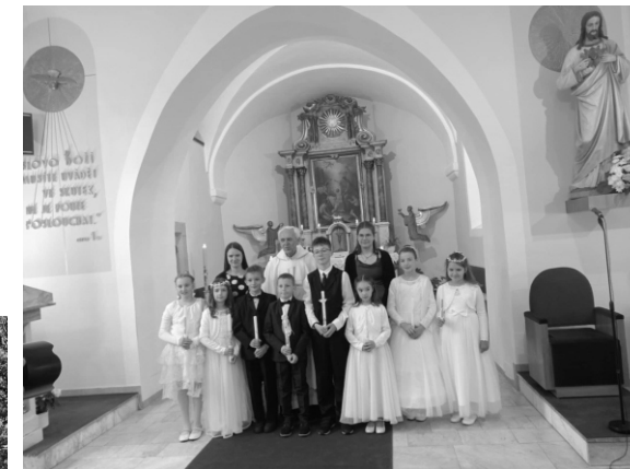
1. Sv. Přijímání v Březnici