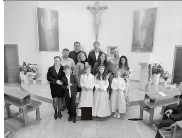
1. Sv. Přijímání v Bohuslavicích