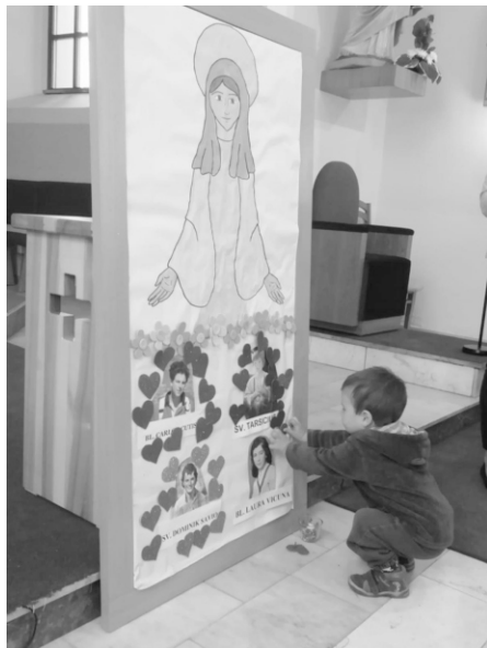
Dětské májové pobožnosti v Březnici