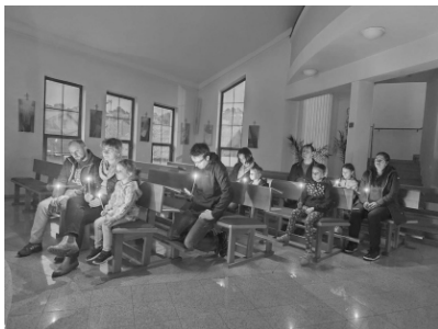
Noc kostelů Bohuslavice